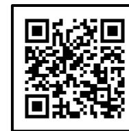
令和7年度入園説明会 予約フォーム

※入園説明会やご予約等について、ご質問がある方は、 下記までご連絡下さい。 対応時間：10:00~18:30（土、日、祝日を除く）